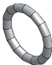
Těsnicí O-kroužek LBP